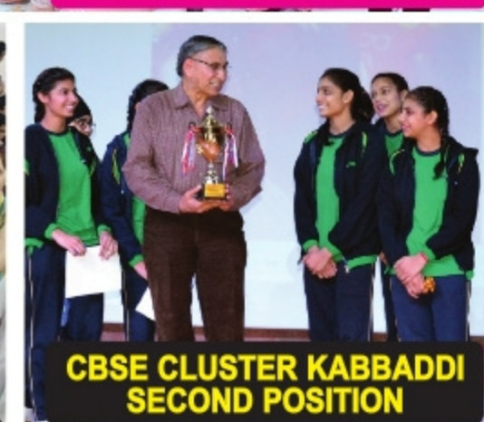
CBSE CLUSTER KABBADDI SECOND POSITION