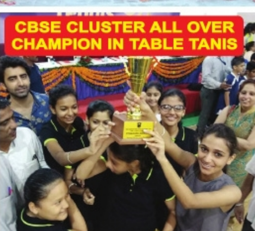
CBSE CLUSTER ALL OVER CHAMPION IN TABLE TENNIS