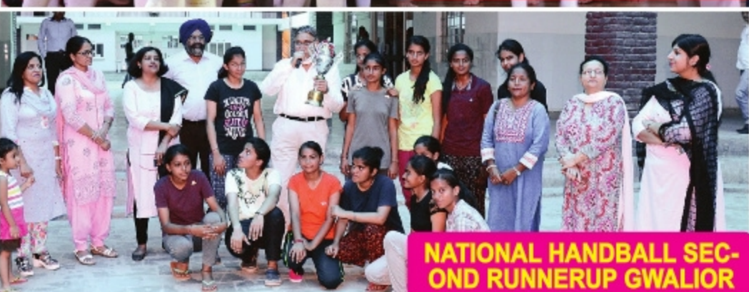
NATIONAL HANDBALL SECOND RUNNERUP GWALIOR