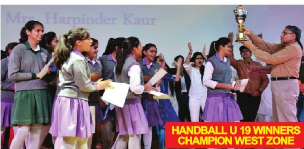
HANDBALL U 19 WINNERS CHAMPION WEST ZONE